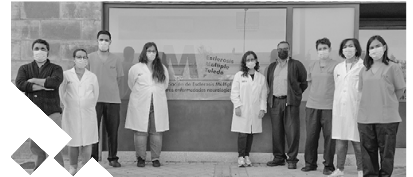
Equipo interdisciplinar de ADEMTO.